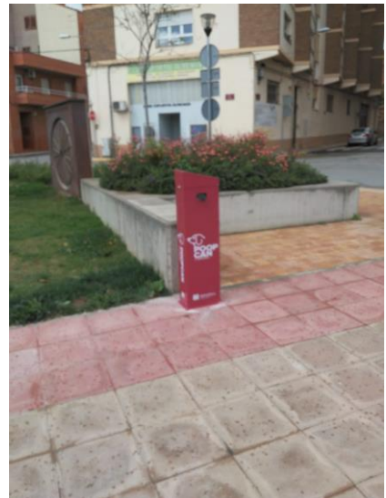
Plaça la Libertat