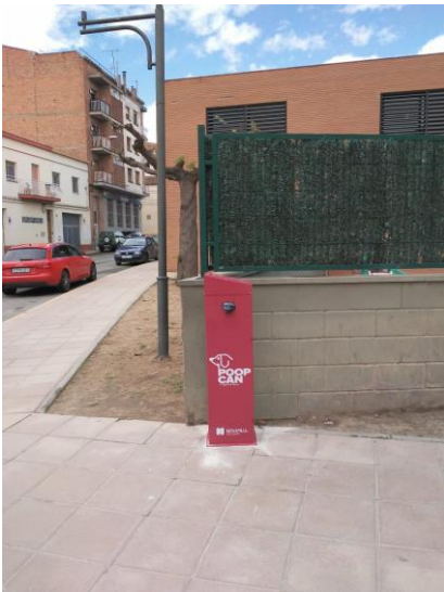
Cantonada carretera amb c/Cerés